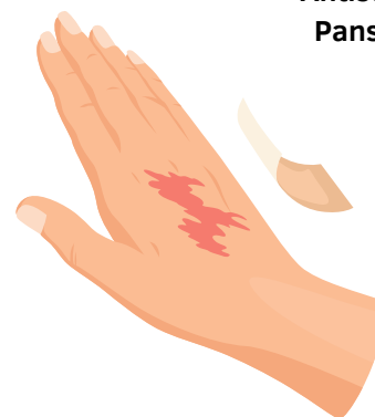
Protégez la plaie avec un pansement