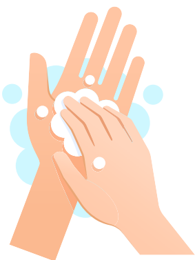
Lavez-vous les mains